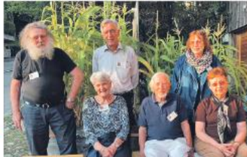
Das Team des Ortsgemuseums Hönegg wartete vor dem Fändeliech auf die Gäste.

Die Sammlung und Ausstellung alleine sind an sich schon einen Besuch wert. Doch sich mit der Taschenlampe nachts durch die Räume zu bewegen, hat auch eine angenehm unheimliche Komponente. Eine schöne Idee des Ortsgemuseums und hoffentlich nicht zum letzten Mal erlebbar. (pas) ■