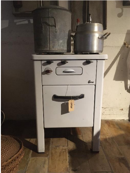
Alter Gasherd mit einem typischen alten Dampfkochtopf.