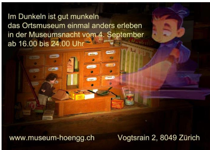
Flyer für die lange Nacht der Museen im Ortsmuseum Höngg.

Unter dem Motto "Im Dunkeln ist gut munkeln" war das Museum in der Museumsnacht vom Samstag, 4.9.2021 offen. Speziell war, dass nur die Treppen aus Sicherheitsgründen beleuchtet waren. Sonst brannte kein Licht. Das Publikum erhielt Taschenlampen, um im Dunkeln in die Mystik des Museums einzutauchen.