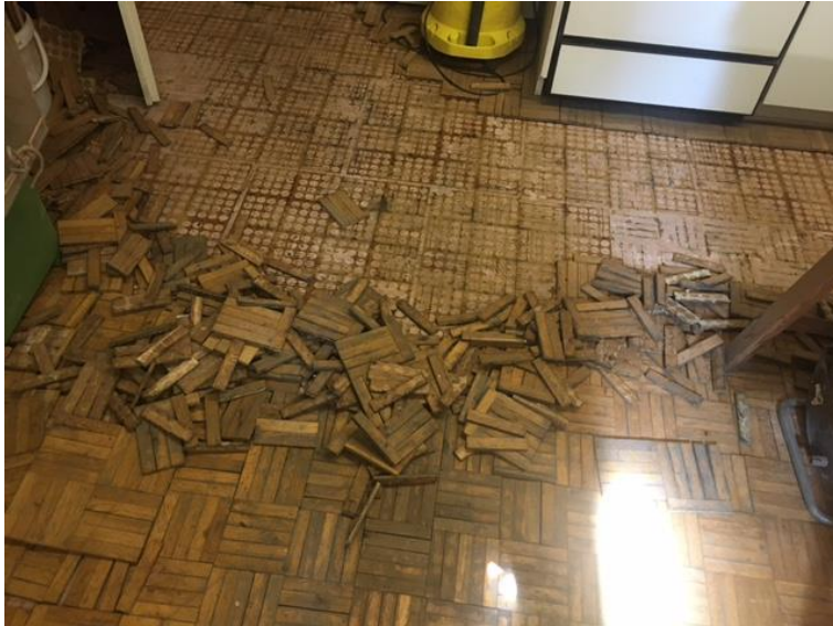
Das eingedrungene Wasser hat den Klötzli-Parkettboden zerstört

In den frühen Morgenstunden des 13.7.2021 zog ein Unwetter mit Sturm und aussergewöhnlichen Regenfällen über einen Teil von Höngg. Dabei drückten die Sturmwinde das Wasser in die Werkstatt des Museums. Dadurch wurde der Klötzli-Parkettboden zerstört. Daraufhin musste die gesamte Werkstatt ausgeräumt werden. Nach dem Entfeuchten des Raums wurde ein neuer Parkettboden gelegt. Schliesslich musste wieder alles eingeräumt werden.