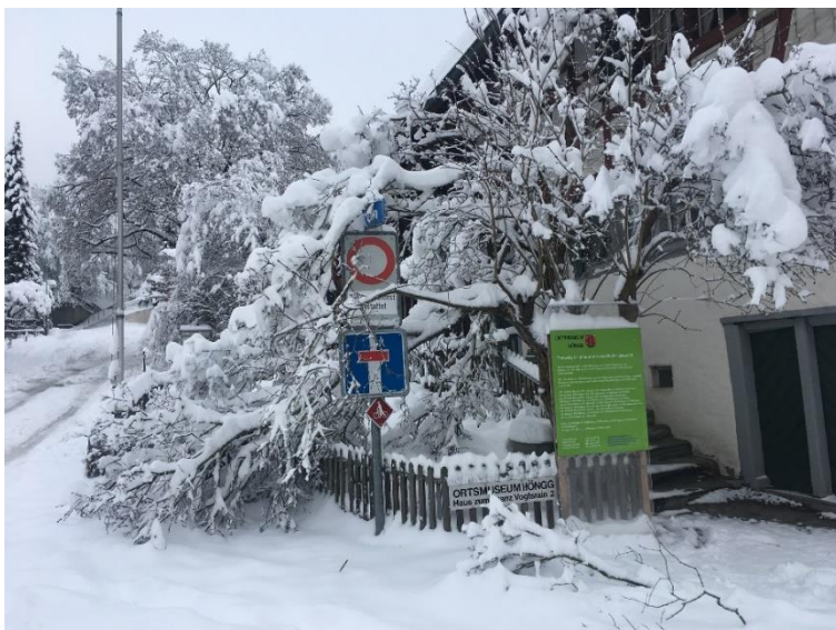
Geknickte Äste am Tag nach dem heftigen Schneefall

Im Jahr 2021 haben die Naturgewalten ihre Stärke gezeigt. Am 14.1.2021 fiel in Zürich fast ein halber Meter Schnee. Dieser Schneelast konnte der Flieder beim Eingang des Ortsmuseums nicht standhalten. Leider mussten einige Äste gekappt werden.